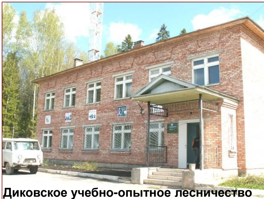
Диковское учебно-опытное лесничество