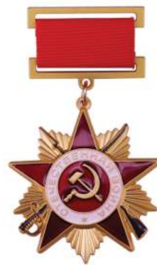
Орден Отечественной войны 1 степени