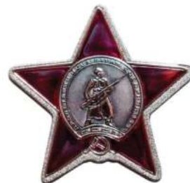
2 Ордена Красной Звезды