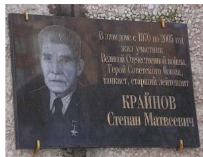
Мемориальная доска на доме, в котором жил Степан Крайнов с 1970 года