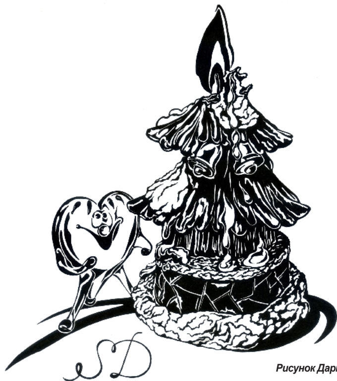
Рисунок Дарьи Слозцовой

Канун Нового года – время ожидания перемен к лучшему, светлых надежд, радостных открытий и, конечно... чудес! Удивительно, что в эти предновогодние дни даже самые убежденные реалисты и прагматики становятся сентиментальными мечтателями. Каждый тайне верит в исполнение сокровенных желаний, какими бы фантастическими и утопичными они не казались наяву. Каждый ждет чуда, субъективного, родного, очень личного явления. Своими представлениями об этом волшебном феномене с нами поделились бывшие редакторы и корреспонденты газеты «Академгородок».