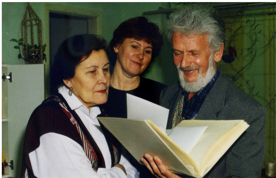
Встреча с бывшими журналистами газеты «За кадры» 2002 год.