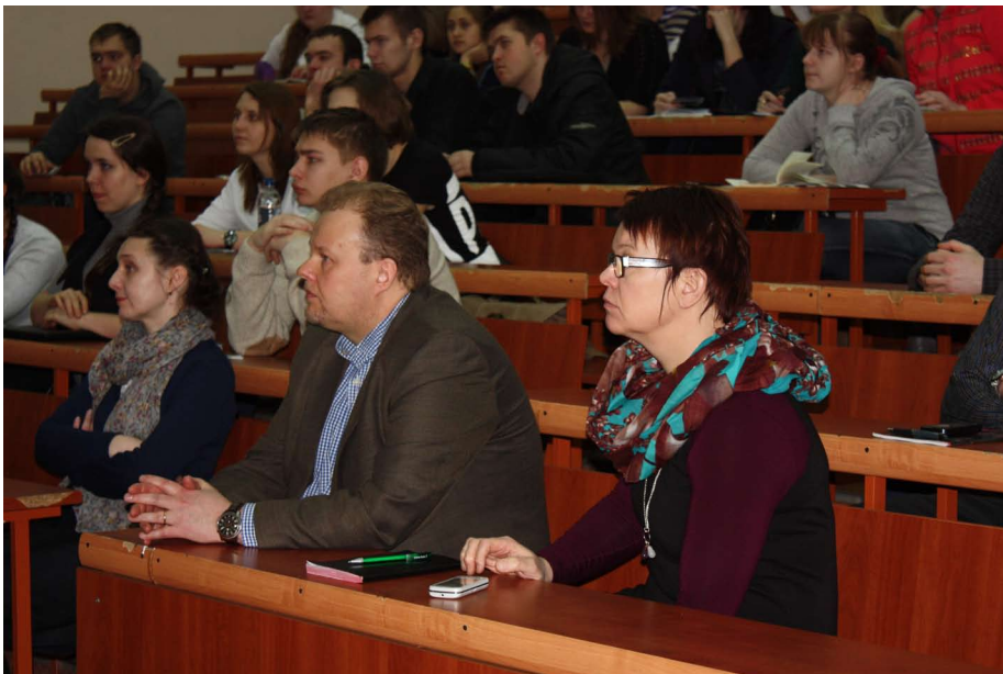
Февральский визит делегации из Финляндии

С целью совершенствования качества подготовки выпускников академии, изучения ими передового опыта зарубежных стран в аграрном производстве, международное сотрудничество становится неотъемлемой частью учебного процесса.