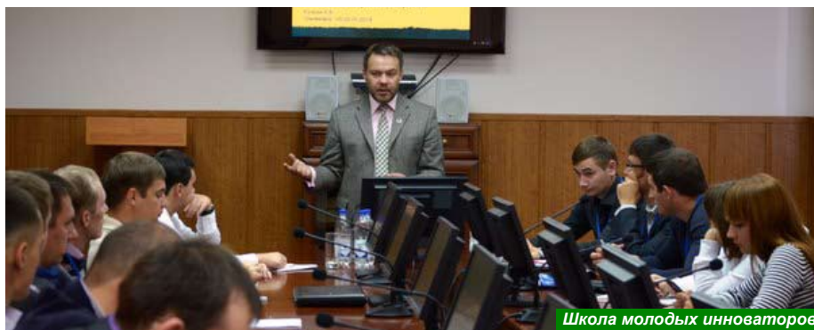
Школа молодых инноваторов

Публикация подготовлена Алексеем Налиухиным по материалам, размещенным на официальном сайте ФГБОУ ВПО Ульяновской ГСХА имени П.А. Столыпина