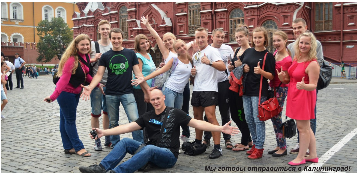
Мы готовы отправиться в Калининград!

Уже в четвертый раз Калининград гостеприимно собирает молодежь со всех уголков России и зарубежья на международный форум «Балтийский Артек». В этом году он проходил с 7 по 14 августа неподалеку от Филинской бухты в Калининградской области. О интереснейшем форуме из первых уст – корреспондент «Академгородка» побывала здесь и описала все свои эмоции для наших читателей.