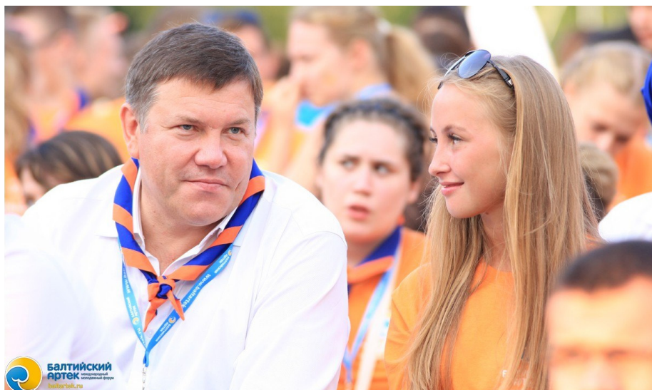
Губернатор области О. А. Кувшинников посетил Балтийский Артек.

Коротко о жизни в палатках — «ЭТО СПАРТАААА!». Как и объявлялось ранее, для участников поставили несколько рядов умывальников, построили душевые отдельно для мальчиков и девочек. В первые дни стояла жара, поэтому мыться в прохладной воде было сплошным удовольствием. Однако переменчивая калининградская погода включила нам дождь! Он лил каждый