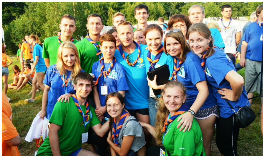
Вологодская делегация на открытии форума.

Вечера всегда были насыщены либо спортивными мероприятиями, либо творческими, либо интеллектуальными. Зачастую несколько увлекательнейших программ шли одновременно. Для самых отважных и стойких проводился конкурс «Балтийский герой». Претендентам на звание «Балтийского героя» предлагалось пройти непростые испытания, объединившись в команды по 10 человек. Первым сюрпризом для участников стала стрельба из лука от клуба исторической реконструкции «Западная башня». Далее следовала полоса препятствий, которую балтартковцы должны